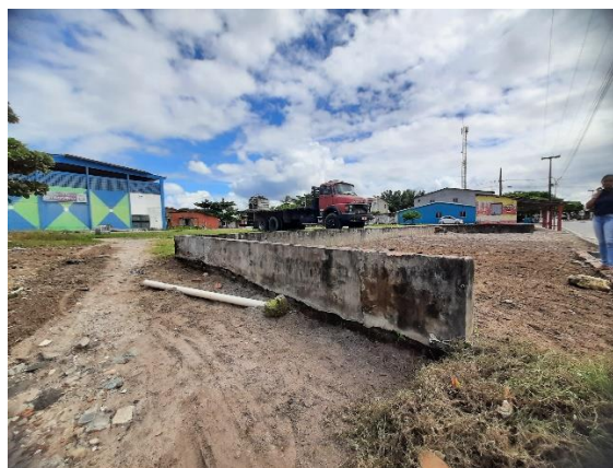
Imagem 04: Vista do terreno com o talude existente Autoria: Equipe de Engenharia e Arquitetura PMP