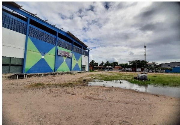
Imagem 02: Vista dentro do terreno frente com a quadra poliesportiva. Autoria: Equipe de Engenharia e Arquitetura PMP