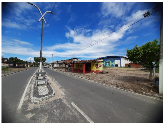
Imagem 01: Vista da Rua principal Julio Feliciano de Sá.