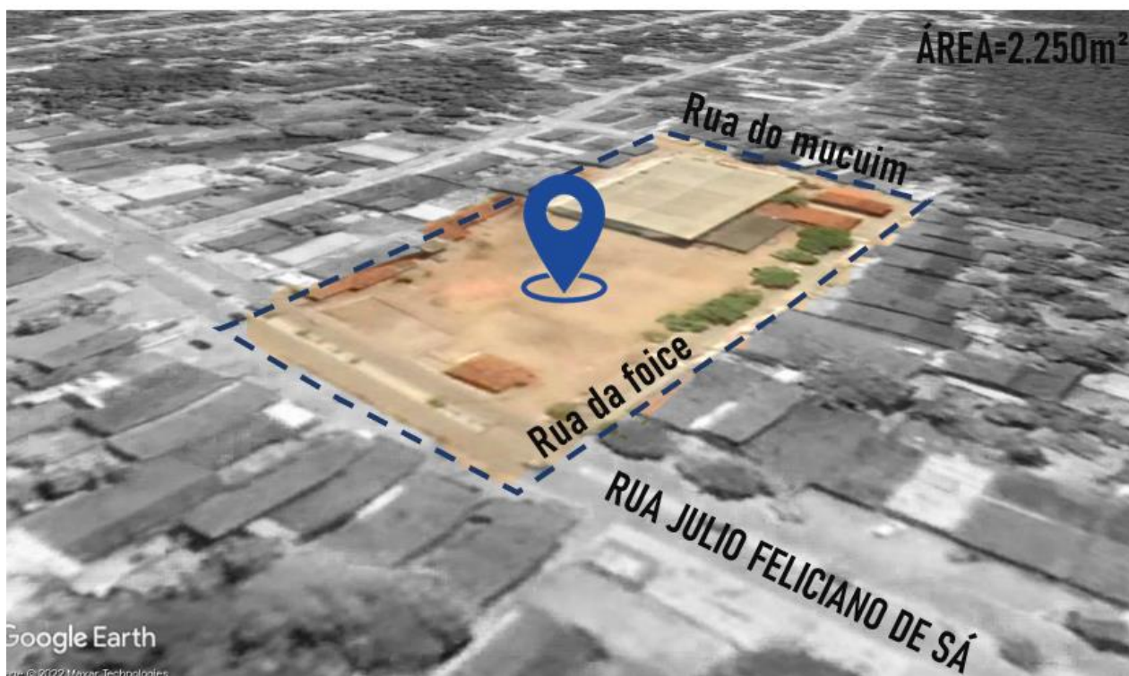
Figura 1: Vista aérea da área de projeto.

O projeto urbanístico de revitalização visa apresentar os elementos gráficos e textuais necessários para intervenção no espaço público. Foi elaborado de acordo com as diretrizes fornecidas pela Prefeitura Municipal, respeitadas as normas e regras vigentes, e é parte integrante da proposta geral para toda área.