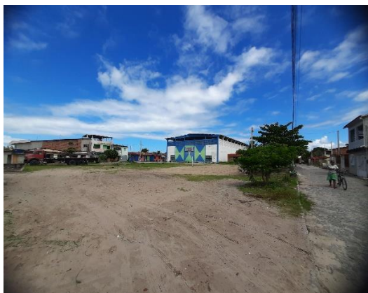
Imagem 03: Vista do terreno