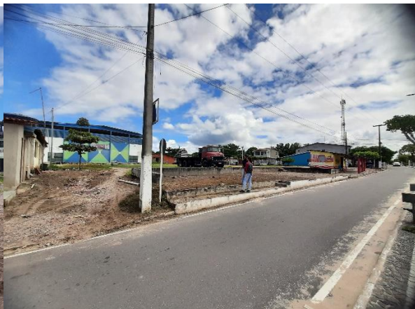
Imagem 06: Vista lateral do terreno Autoria: Equipe de Engenharia e Arquitetura PMP