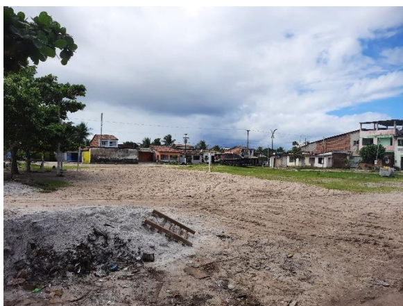
Imagem 05: Vista lateral do terreno Autoria: Equipe de Engenharia e Arquitetura PMP