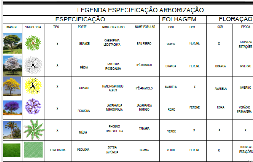
Figura 03: Tabela de vegetação.